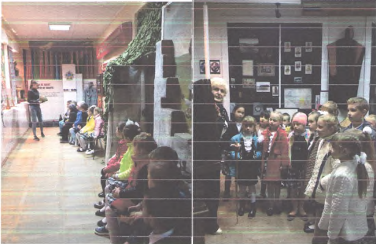
Посещение музея. Зал «Боевой Славы».