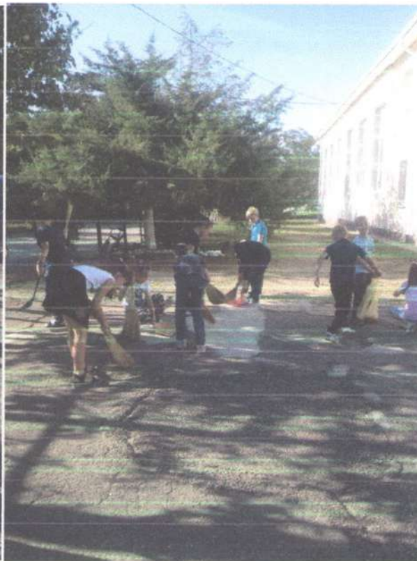
Участие в акции «Сохраним чистым свой город»