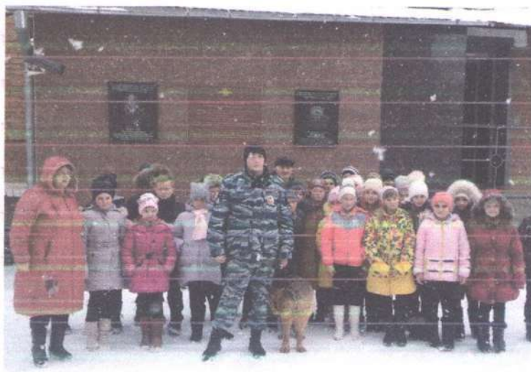
Посещение музея полиции города Лабинска