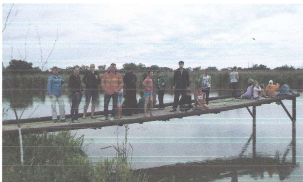
Родители принимают участие в изучении животного и растительного мира водоёма