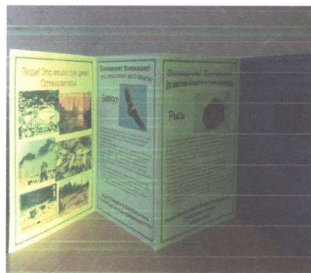
Книжка – раскладушка «Спасём свою любимую планету»