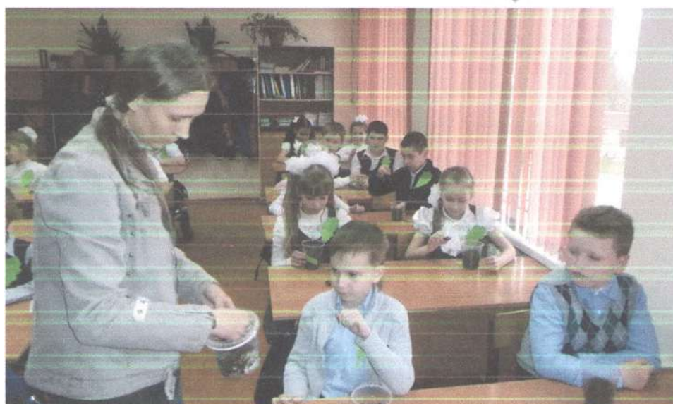
Специалист – эколог рассказывает, как правильно посадить семена дуба обыкновенного, чтобы из него вырос саженец.