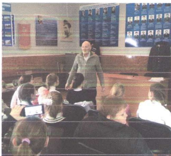
Встреча с ветераном