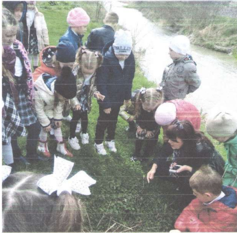
Экскурсия в природу