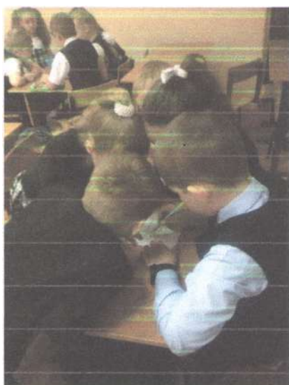
Викторина с экологическими заданиями