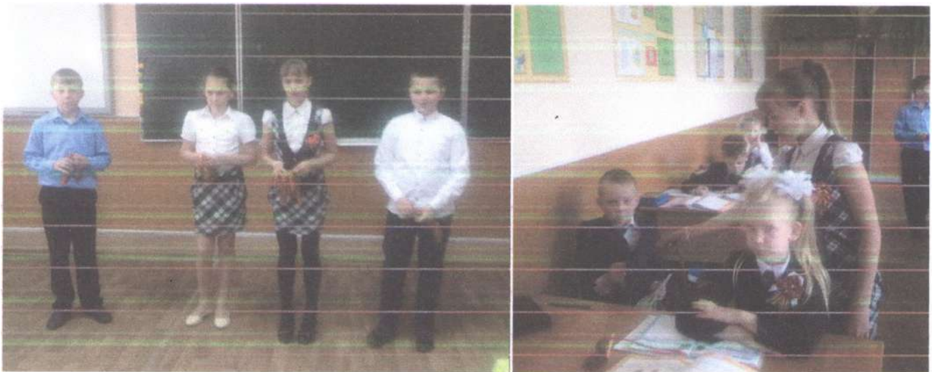
Школьная акция «Георгиевская ленточка»