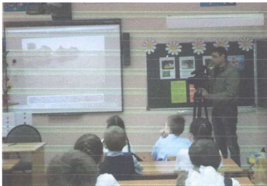
Участие в акции «Вырасти дерево», на мероприятии присутствовала съёмочная группа телекомпании «Лаба» (г. Лабинск)