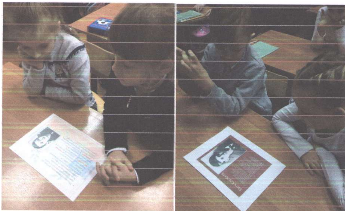
Классный час «Юные герои - антифашисты»