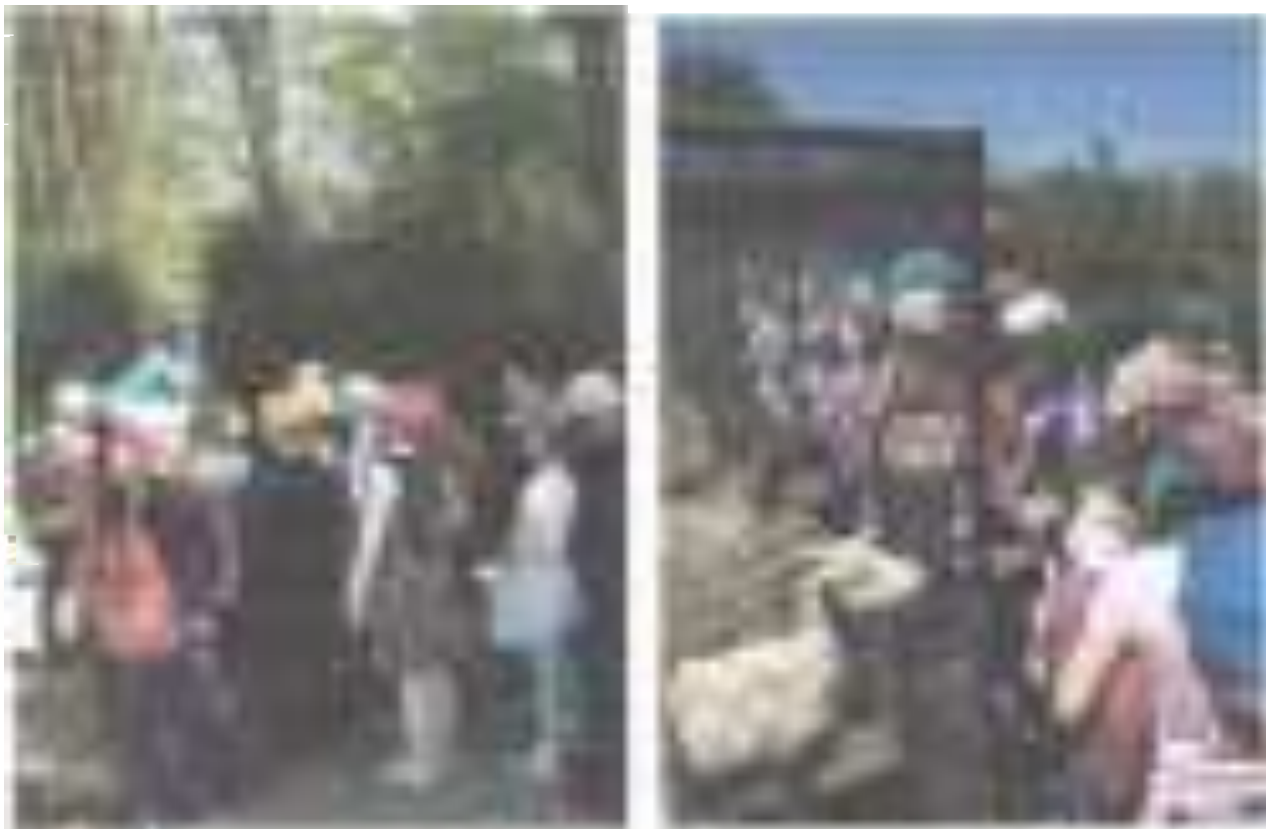
Посещение эколого – биологического центра г. Лабинска